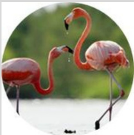
Le Flamant rose

Ces eaux particulièrement riches en plancton, permettent la prolifération de multiples variétés d'animaux marins, qui serviront à alimenter les oiseaux et poissons.