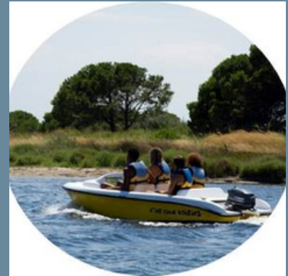
Bateau sans permis