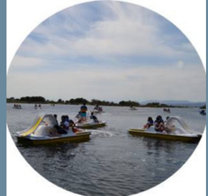
Chasse au Trésor (en canoë ou pédalo)