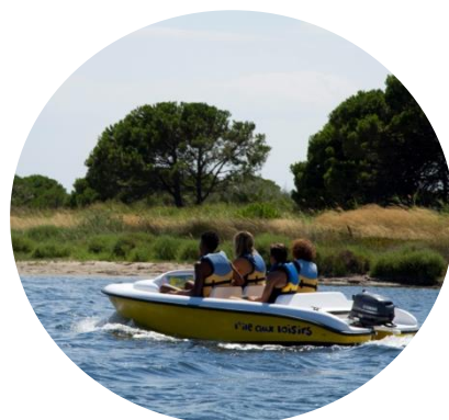
Bateau sans permis