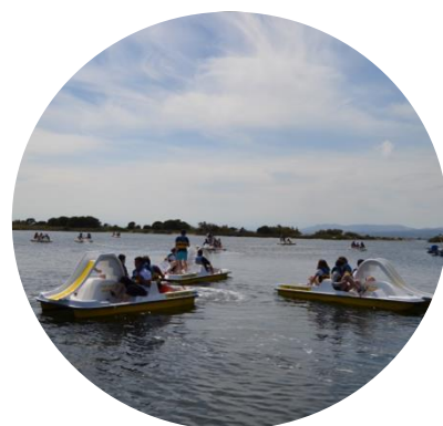
Chasse au Trésor En canoë ou pédalo

Toutes nos activités sont gratuites pour les moins de 6 ans. Tout le matériel nécessaire à l'activité est fourni. Gilets de flottaison à disposition pour tout le monde. Le port du gilet est obligatoire pour les moins de 12 ans, et pour tout le monde dans le cadre d'une activité canoë et bateau sans permis.