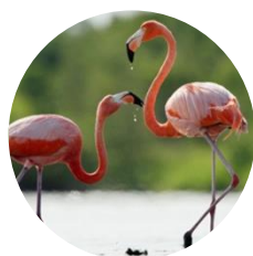
Le Flamant rose

L'étang de Salses-Leucate présente une très belle diversité d'habitats naturels (roselières, sansouïres, prés salés, dunes, etc.), qui abritent des espèces végétales et animales remarquables. Ces eaux particulièrement riches en plancton, permettent la prolifération de multiples variétés d'animaux marins, qui serviront à alimenter les oiseaux et poissons.